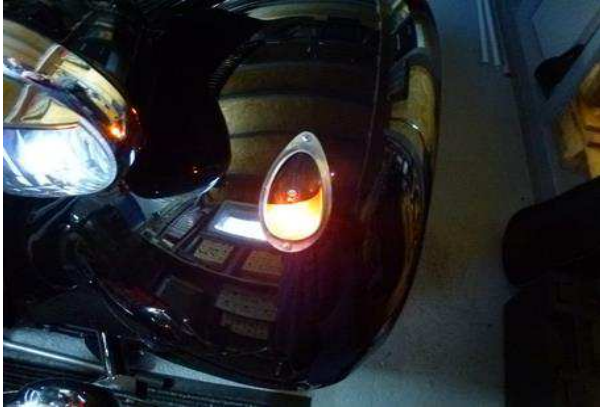
A) 6,4V 18W