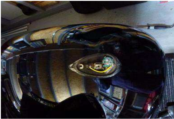
C) LED eingebaut